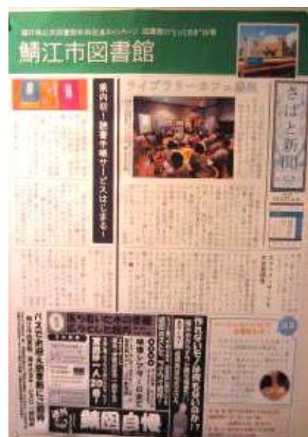
鯖江市図書館の「さばと新聞」

県内には魅力ある図書館がいっぱい。 各図書館それぞれに「うちはココがスゴイ！」 を手作りポスターでアピールしました。