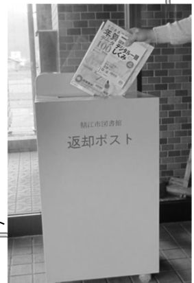
市内4か所設置の返却ポスト