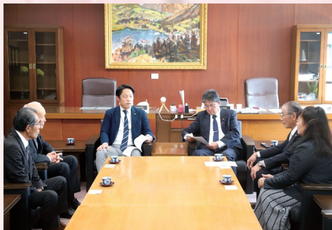
市議会あて要望提出

「持続可能な農業の実現に向けた経営対策の推進について」など5項目について要望書を提出しました。