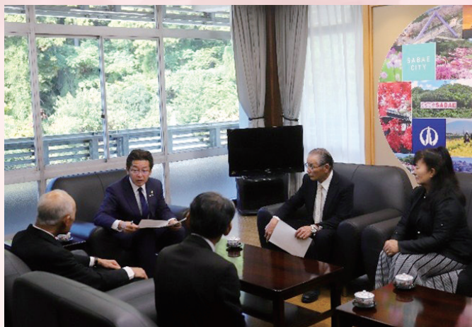
市長あて要望提出