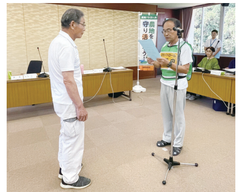
農地パトロール実施に先立ち、農地調整部会長から農業委員会会長へ宣誓を行いました。