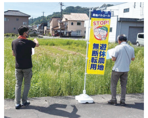
農地パトロールのようす

鯖江市農業委員会は7月27日、鯖江市役所において令和7年度農地パトロール出発式を開きました。市内農地の利用状況を確認し、適正な運用を促進させるべく活動に取り組みます。