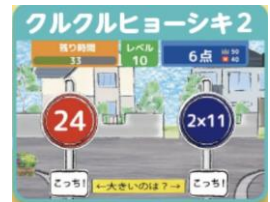
いきいき脳体操イメージ

県内の交通事故状況や交通安全の知識や 令和8年4月から施行される自転車青切符制度など