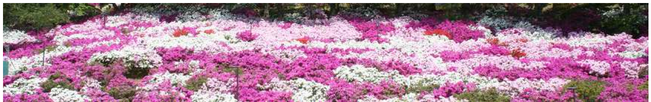
Công viên Nishiyama _ Hoa đỗ quyên