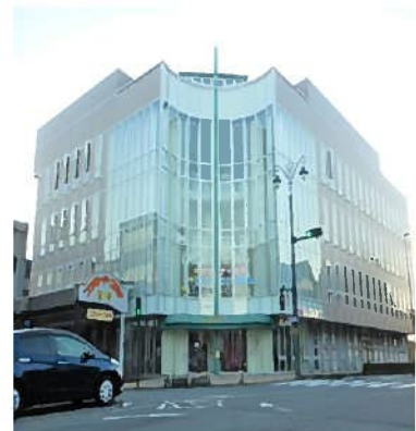
しみん 市民ホールつつじ

■市民ホールつつじ （入浴施設、トレーニング施設） 鯖江市本町2丁目2-16 Tel (0778) 54-7000