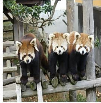
にしやまこうえん 西山公園

■文化の館 （市立図書館、書籍貸出し、英字新聞） 鯖江市水落町2丁目25-28 Tel (0778) 52-0089