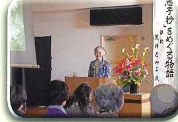
講演会「智恵子抄」をめぐる物語