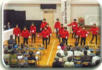
オープニング「リズム体操」発表

これにより、女性の意見や提案が町内のまちづくりにかされる機会が増えることを期待したいものです。