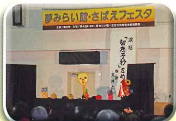
人形劇「フレンドリーズ」発表