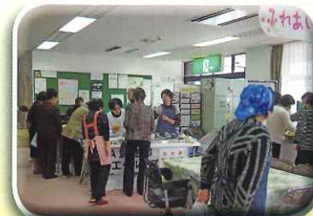
各団体によるバザー