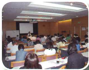
ウイングス京都にて研修

また、移動のバスの中では、各団体の様子を語り合うなど、会員同士の親睦も深まり、和やかな雰囲気の中で有意義な研修となりました。