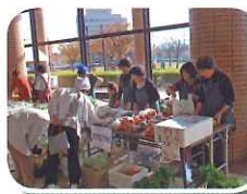
ネットワーク団体バザー