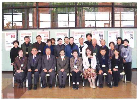
「女と男輝くさばえフェスタ 2013 講演会講師・田部井淳子氏を囲んで」