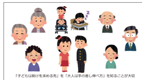
「鯖さん一家 ～やさしくすること/されること～」

みんな、それぞれの個性を活かして「ありがとう」と笑顔で言える場所をつくっていきましょう