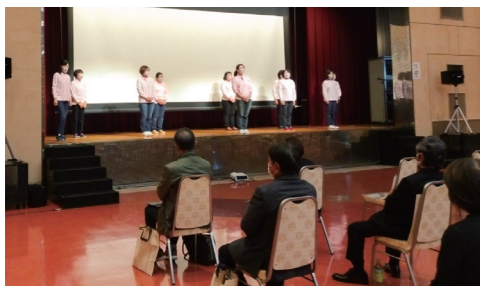
「女と男輝くさばえフェスタ」での市愛育会による体操