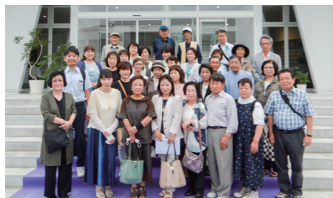
「きらめきフェスティバル」での研修会を通じたメンバー交流