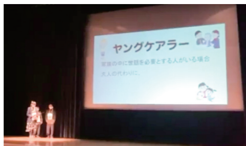
「青少年健全育成鯖江市民大会」での新作朗読劇発表