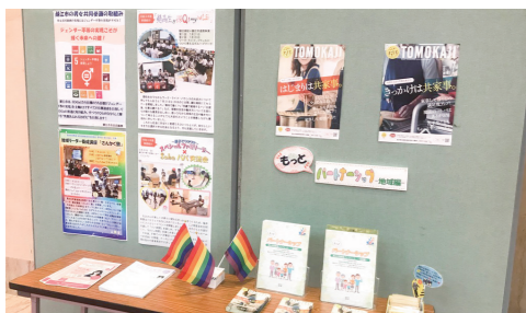
「女と男輝くさばえフェスタ」でのパネル展示