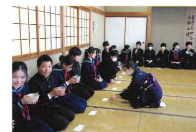
間部の殿様学習会 〈惜陰小〉