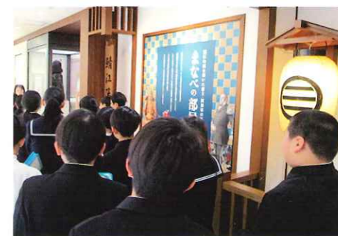
間部の殿様学習会 (進徳小)