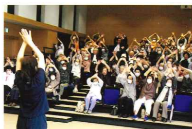
ひとり暮らし高齢者の集い