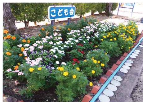
花によるまちづくり コンクール