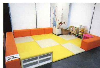
子どものびのび広場〈1F〉