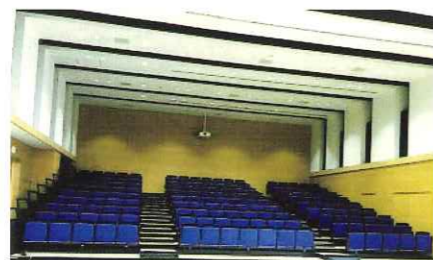
大ホール 移動観客席

開館：AM8:30～PM10:00 休館：第1・3日曜日、第2・4火曜日 祝日、年末年始 ※毎年のイベント等により休館日は変更となりますので下記QRコードでご確認ください。