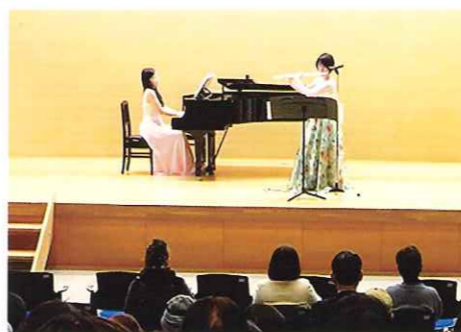
スプリングコンサート