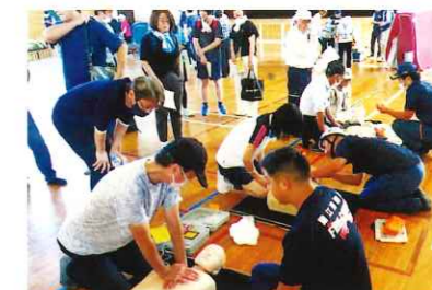
地区防災訓練（令和5年度）