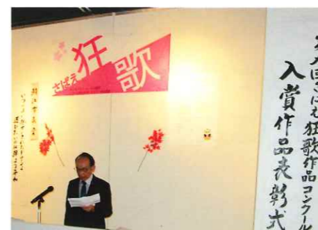
さばえ狂歌コンクール