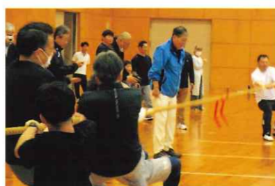
間部杯綱引き大会

この誇りある鯖江地区の歴史、伝統、文化を次世代へ継承し、先人の歩みに感謝しながら、時代に即応した、健康、安全で安心して住み続けられるまちづくりに取り組みます。（実施項目は毎年度更新されます）