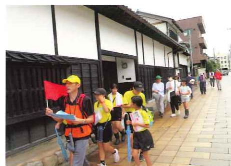
間部の殿様 ふるさとウォーキング