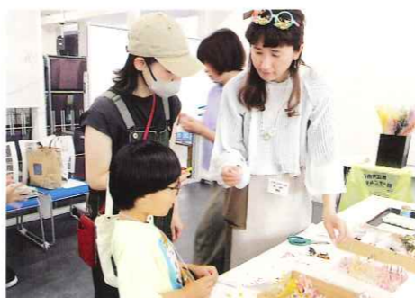
わくわくふれあい広場