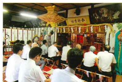
間部詮勝公顕彰祭