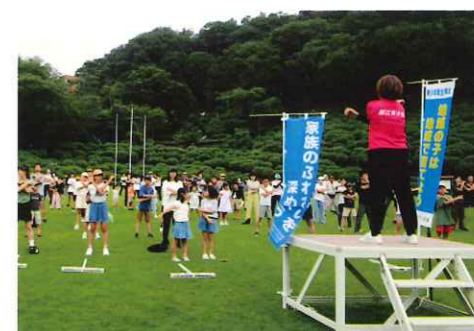
さばえラジオ体操デー