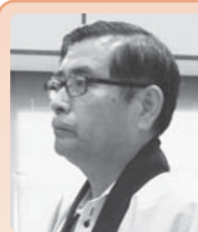
公明党 遠藤 隆 議員