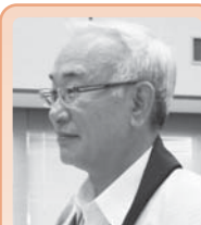
日本共産党 菅原 義信 議員

答 この指針をもとに、教育の事業展開を図ること、誰もがふるさと鯖江のこころを知り、ふるさと鯖江に愛着と誇りを持って、ふるさと鯖江に住む喜びを感じる市民主役のまちづくりが進められ、その人材を育成し、地方創生とつなげていくということを目指しているものです。校長会や公民館長会なども通し、大綱を理解していただき、地域でのふるさと学習にも積極的に力を入れていっていただきたいと考えている。