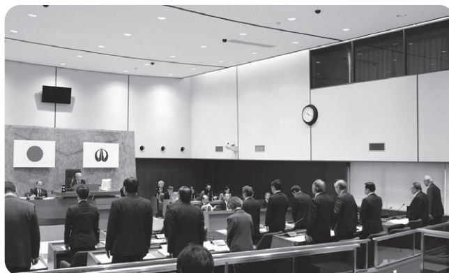
本会議場で起立し、全会一致で削減議案を可決する議員