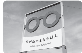
市の経済回復支援

答 経済活動の低迷は超長期化するものと見込まれ、企業による雇止めや倒産に追い込まれる企業などの対策も検討していかなければならない。今後は、感染の拡大防止と経済活動の両立を図りつつ、ウィズコロナ、アフターコロナを見据えた新たな支援策を産業界と一緒に、検討していきたいと考えている。