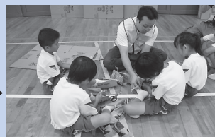
片上地区会場 (段ボールでスリッパ作り)▶