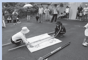
北中山地区会場 (毛布で簡易担架作り)