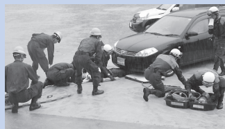
河和田地区会場 (消防レスキュー)