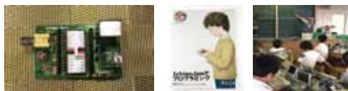
こどもパソコン IchigoJam 1,500 円~ キーボードとテレビをつなぎます(教科書登場)

本こうづはオープンデータです。だれでも自由にてんさい・はいふできます。 せいかつにかかせない、IT。小さなころからコンピューターに親しんでもらうために サンプルにプログラミングできる、さげえ生まれのコンピューター こどもパソコン 「IchigoJam」。さげえ市内、ふくい県内を中心にさまざまなかちきでワークショップを開 いています。ごきょうみある方は、どうぞお近くのイベントや教室をチェックしてみ てください! http://ichigojam.net/