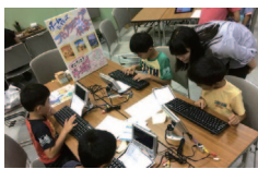
キーボードとテレビを つないでつかいます