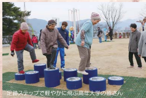
足跡ステップで軽やかに飛ぶ高年大学の皆さん

これらは、(一財)自治総合センターが宝くじの社会貢献広報事業の一貫として行っている宝くじのコミュニティ助成事業を活用したもので、公園利用者の要望に基づいて設置したものです。