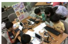
キーボードとテレビをつないでつかいます