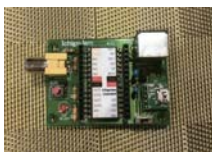
IchigoJam 1,500 円～