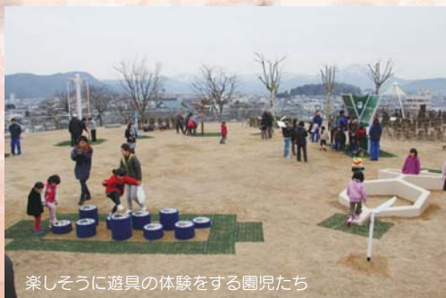
楽しそうに遊具の体験をする園児たち

遊具は、2カ所合わせて全13種(計14基)設置されています。結びの広場の遊具は、ストレッチとバランスを目的としたもので、それぞれの目的に分かれて円形に配置されています。大人から子どもまで幅広い世代が一緒に遊べる遊具です。家族皆さんでぜひ遊びに来てください。