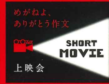
「めがねよ、ありがとう作文」 ショートムービー上映会