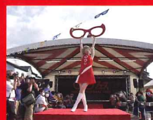
めがねファッションショー