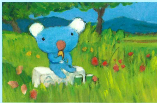
『おなかすいたね、ペネロペ』より