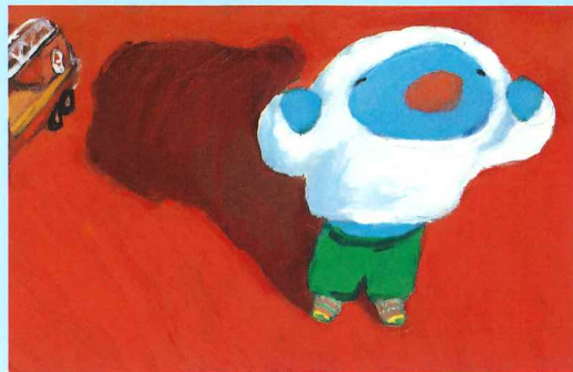
『ペネロペ ひとりでふくをきる』より