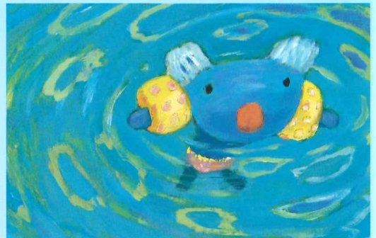
『ペネロペ うみへいく』より