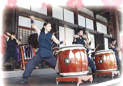
オープニングイベント 仁愛大学 和太鼓『仁』