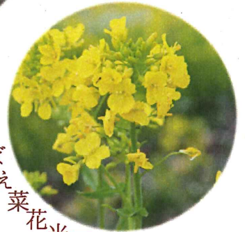
さばえ菜花米圃場