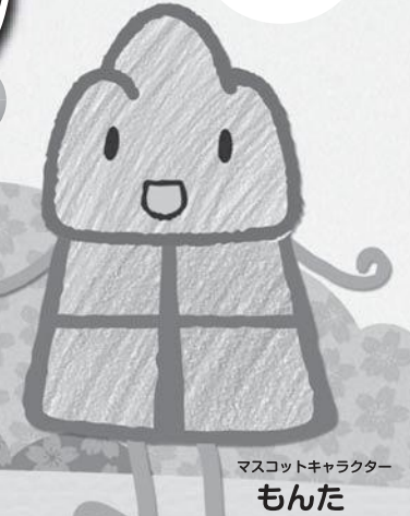
マスコットキャラクター もんだ