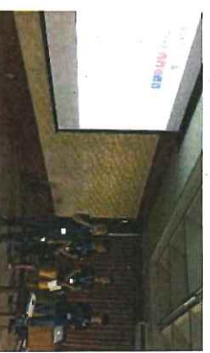
最終成果報告会プレゼン