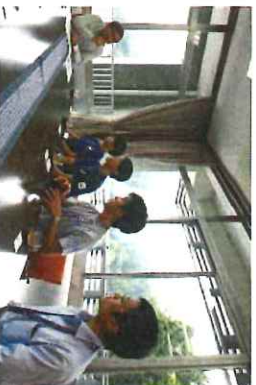
牧野市長を表敬訪問