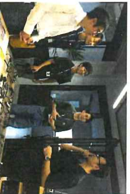
BOSTON CLUB 訪問