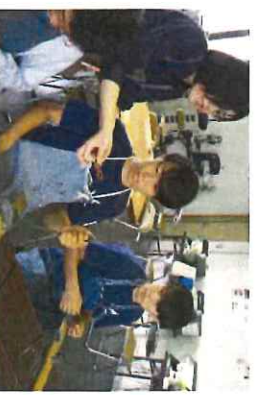
めがねミュージアムにて制作体験