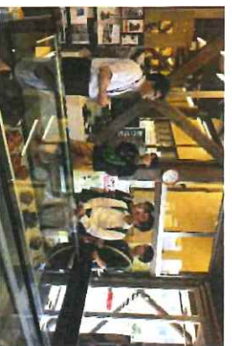
市内にて企業訪問と史料館見学