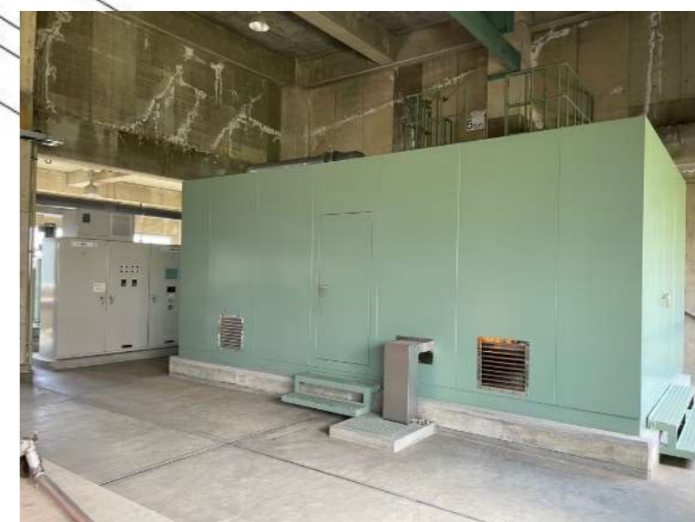
汚泥処理機械設備更新（機械濃縮設備） (R5～R6)