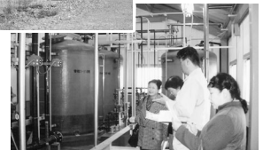
処理施設見学風景